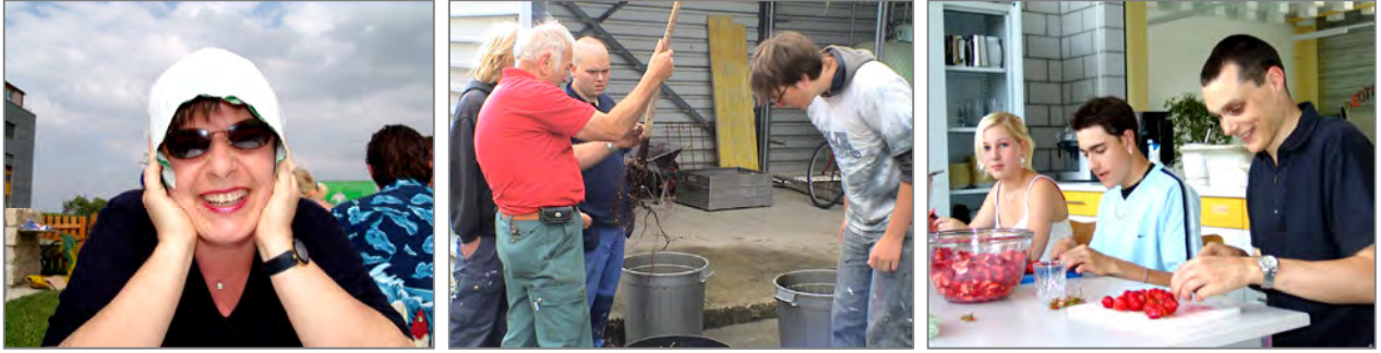
Arbeit und Spass – Eindrücke aus dem Motivationssemester-Alltag