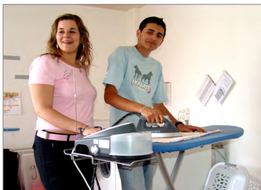
Schön, dass 'er' es auch kann!

Das war's schon, danke für Deine offenen Antworten.