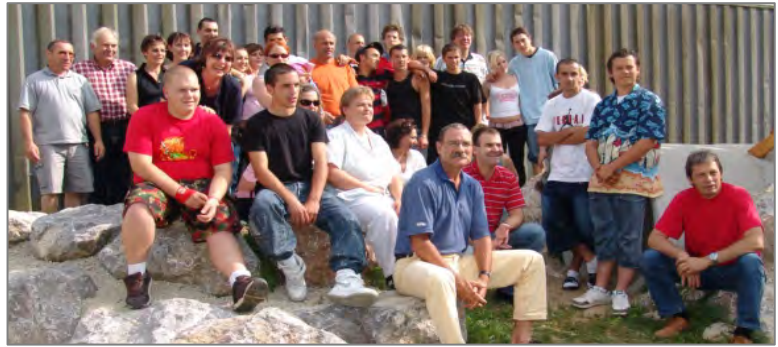
Motivationssemester Abschlussfest, 23. Juni 2006 – Freude über erreichte Ziele