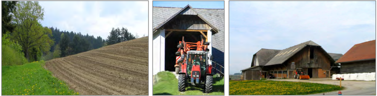
Guglera: Landwirtschaft und Forst

Der Landwirtschaftsbetrieb der Guglera soll ein Modellbauernhof in diesem Sinne werden. Urlaub auf dem Bauernhof, Landschulwochenaufenthalt, Therapien durch das Erfahren vom Leben und Arbeiten mit Tieren, die Bewirtschaftung der klassischen Landwirtschaft, Herstellung und Veredelung der erzeugten Produkte; die Grenzen vom Konsumenten zum Beitragenden werden fließend, können den persönlichen Bedingungen und Wünschen angepasst werden.