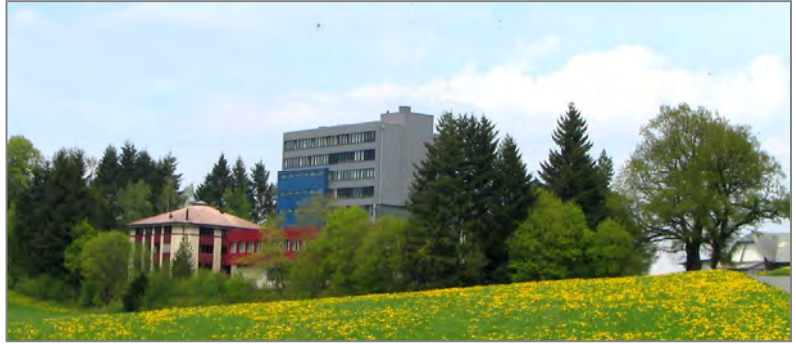
AG Institut St. Josef Guglera, Giffers (Freiburg, Schweiz)