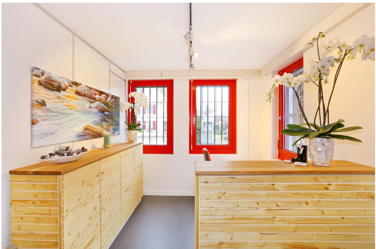
Empfangsbereich des Körperpflegezentrums

Beat Fasnacht, Stiftungsrats-Präsident und das ganze Team