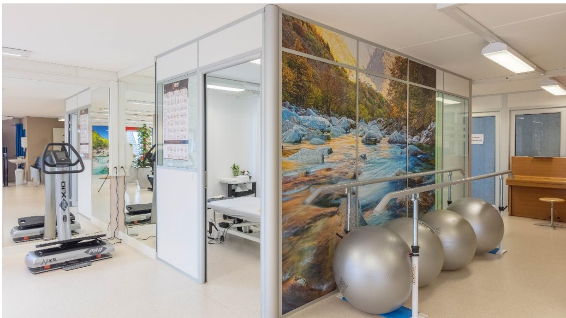
Blick in Massage-Räume im Körperpflegezentrum