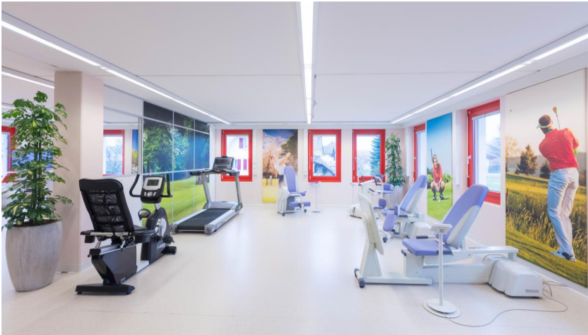
Bewegung und Sport im Körperpflegezentrum

Dieses komplette Angebot wird den Kunden zu einem Preis von CHF 20 pro Halbtage angeboten. Bei längerer Massage und Fusspflege wird ein Aufpreis verlangt. Bei Personen, die finanziell nicht in der Lage sind die CHF 20 zu bezahlen, übernimmt die Stiftung den Betrag vollständig. Von dieser Hilfe profitieren gegenwärtig rund 13% der Kunden. Damit gewährleistet die Stiftung deStarts, dass alle Menschen Zugang zum Angebot der tri-care santé haben, unabhängig ihrer finanziellen Möglichkeiten.