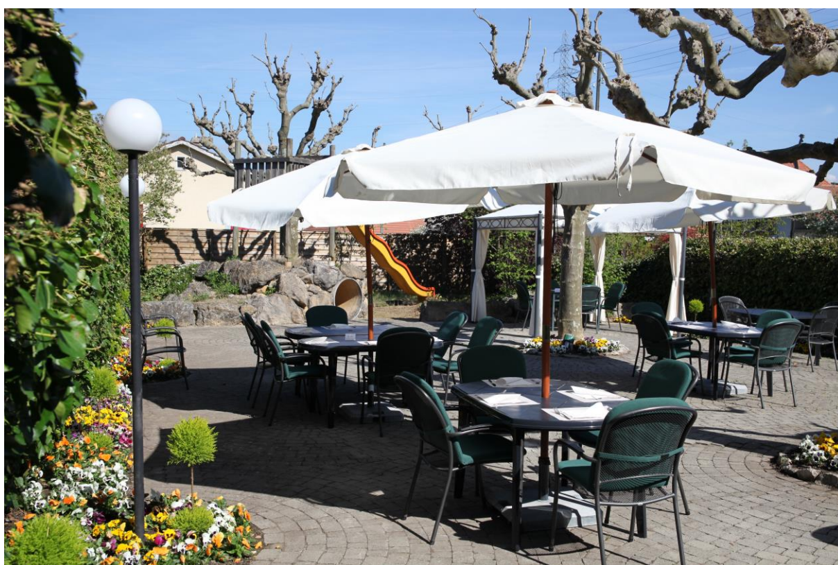
Gartenterrasse des Restaurants zum Kantonsschild