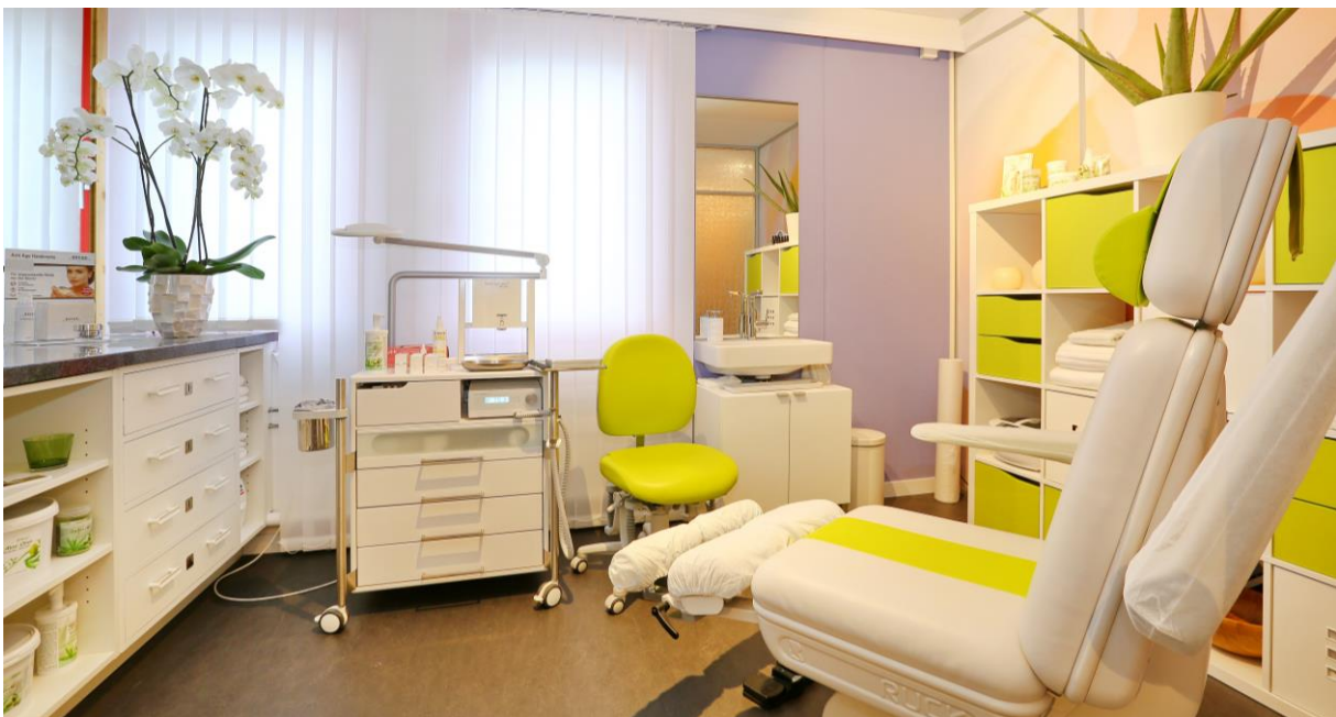
Fusspflege-Studio im Erdgeschoss

Mit jeweils rund zehn bis zwölf Teilnehmern veranstaltet Heinz Bangeter einmal pro Woche ein Gruppentraining. Dieses dauert rund 30-45min und wird im Sommer durch Aktivitäten im Freien, wie gemeinsames „Walken“ in Galmiz, ergänzt.