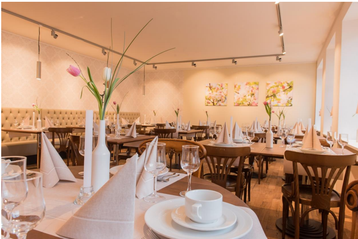
Gaststube des Restaurants zum Kantonsschild

Auch das Restaurant zum Kantonsschild konnte 2017 einen erfreulichen Zugang an Kunden verzeichnen.