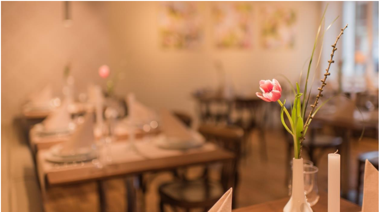
Gaststube des Restaurants zum Kantonsschild

Am Samstag, 3. November 2018 wird im Restaurant zum Kantonsschild das erste Gala-Dinner für Mitglieder des deStarts Freundeskreises und für Sponsoren ausgerichtet.