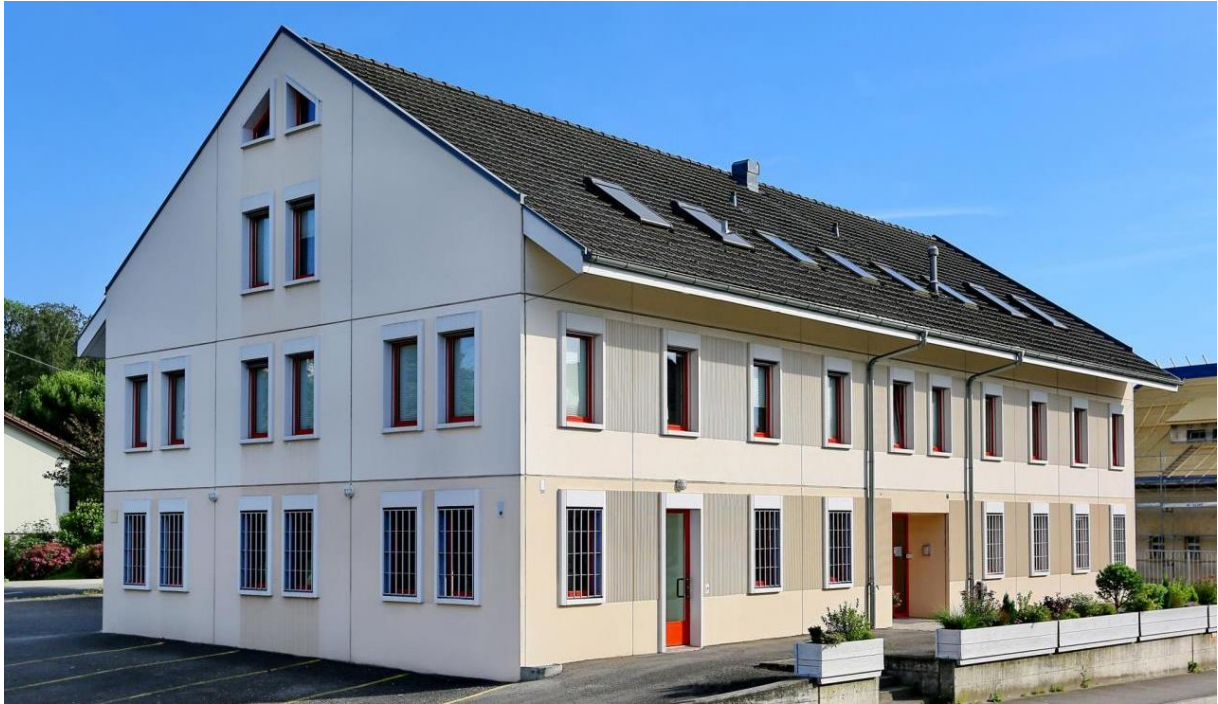
Gebäude der tri-care santé