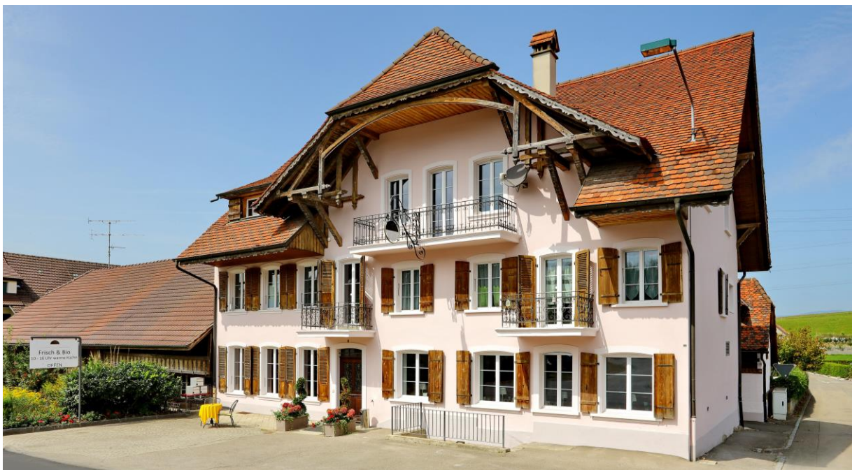
Restaurant zum Kantonschild