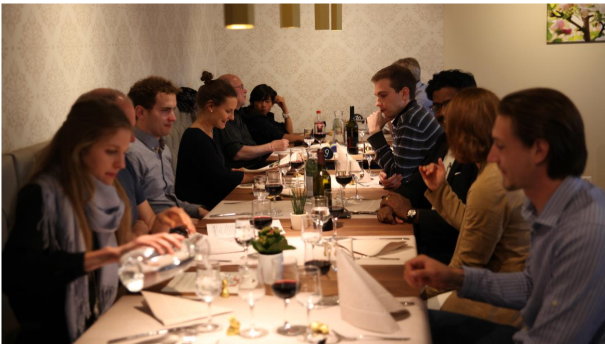
Eröffnungs-Dinner im April 2017